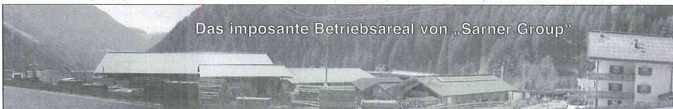
Das imposante Betriebsareal von „Sarner Group“

*Als einzige wöchentlich erscheinende unabhängige Fachzeitschrift für die Forst- und Holzwirtschaft, die Sägeindustrie und den Holz- und Baustoffhandel, ist der Holzkurier die wichtigste Fachinformationsquelle für etwa 17.000 Betriebsinhaber und Führungskräfte aus der Branche.